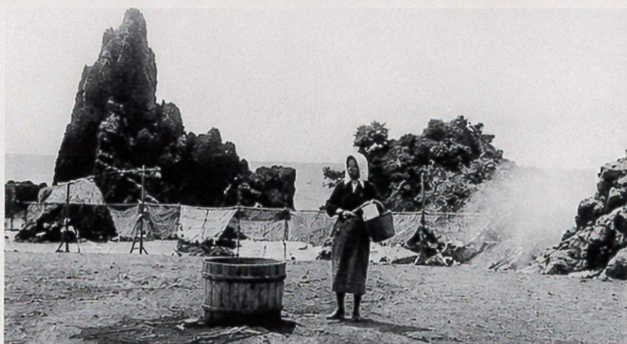
昔の塩まきの様子（昭和初期）

千年以上受け継がれてきた 能登の塩づくり。 先人たちの知恵と技術を 未来へつなぐために、 その第一歩となる 「塩まき初日」を迎えます。 ぜひお立ち寄りください。